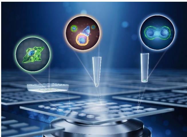
Bild 1: Illustration stellt verschiedene Zellarten in verschiedenen Wellarten dar. v.l.n.r: Adherente Zelle auf mikrostrukturiertem Boden, NK-Zelle „attackiert“ Tumorzelle in U-Well, Zelle beim Teilen in F-Well.